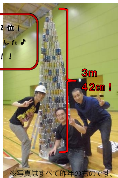
※写真はすべて昨年のものです。