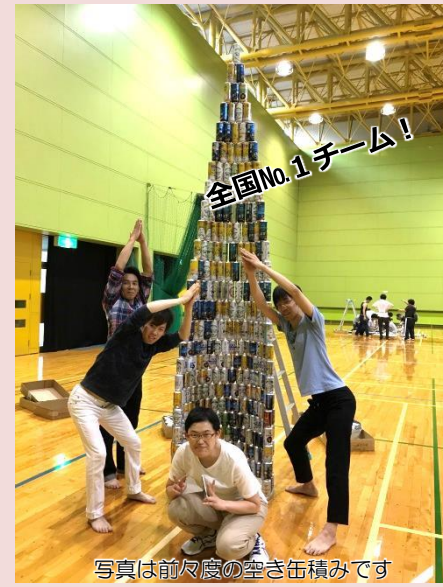
写真は以前のものです