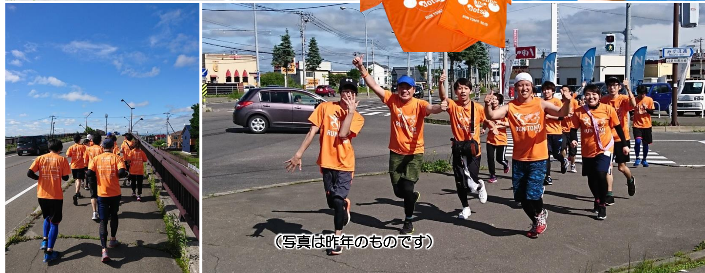
(写真は昨年のもので)